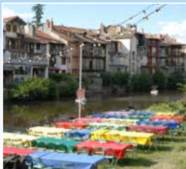
Image touristique majeure d'Aurillac, les Maisons de la Jordanne sont illuminées de mille couleurs et les berges sont baignées d'un éclairage verdoyant et bucolique.